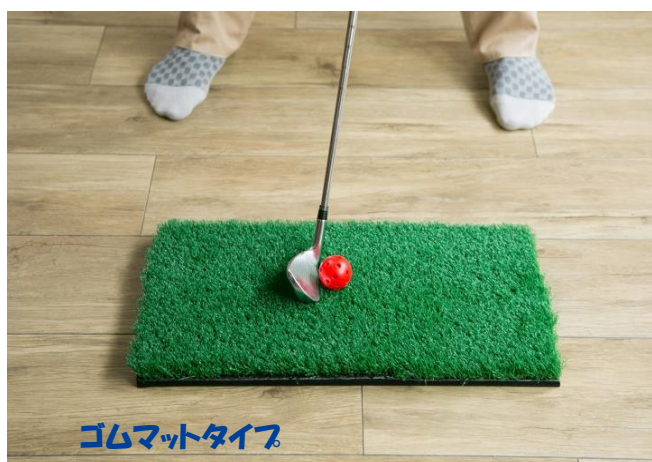
ゴムマットタイプ