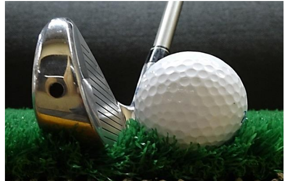
リアルな6アイアンのダフリ